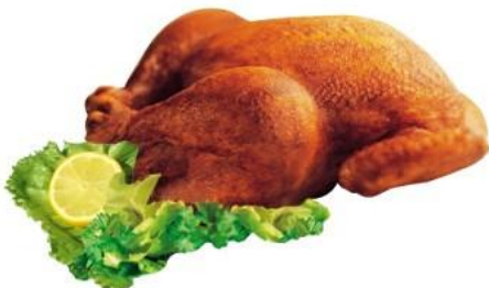
Das herrhafte Hähnchen kam bei der Einweihungsfeier der Badner Schalmeien sehr gut an.

Hähnchen so zu, wie zu Großvaters Zeiten und dies früher auch die „Kleintierzüchter“ taten.