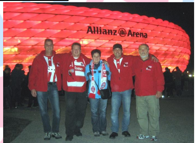
Die Fanclub-Mitglieder feuerten den FC Bayern gegen den AS Rom an.

Am 15. September fand das erste Champions League Spiel der Gruppenphase in der neuen Saison statt. Gegner zum Auftakt war der AS Rom, der wohl für die meisten auch am interessantesten schien.