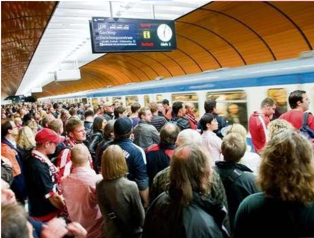
Lebhaftes Treiben in den Münchner U- Bahn Stationen stellt München vor Herausforderung.

Zu dieser Begegnung waren nach ersten Informationen mindestens fünf Fanclub-Mitglieder in München angereist. Aus deren geplanten Stippvisite ins Münchner Zentrum wurde leider nichts, denn neben der IFAT (Messe, neue Perspektiven für die Umwelt), einem Streik des MVV (Münchner Verkehrsverbund) waren auch die Rockbands U2 und One Republic an diesem Tag im Münchner Olympiastadion zu Gast, was zusammen alles zu einem vollendetem Verkehrschaos in der Landeshauptstadt sorgte. Somit war der geplante Besuch in der Münchner Innenstadt automatisch vom Tisch.