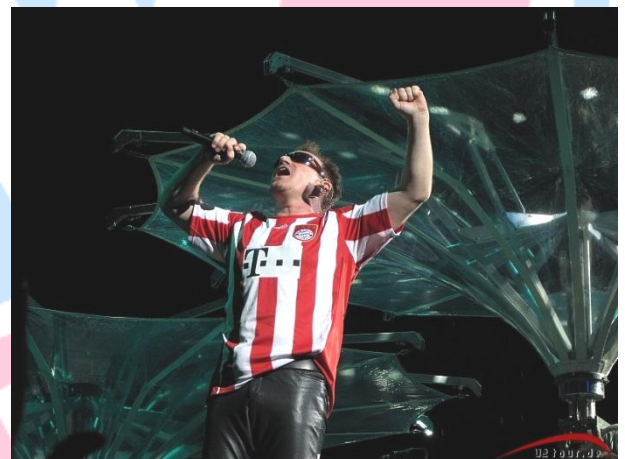
Sänger Bono gab im Trikot von Bastian Schweinsteiger seine Zugabe. Die Menge tobte als er den 2:0 Sieg der Bayern gegen AS Rom bekannt gab.

Kilometer weiter eine besondere Ehre zuteil. Die irische Rockband U2, die zeitgleich zum Champions-League-Spiel der Bayern gegen den AS Rom im Olympiastadion auftrat, huldigte in Person von Leadsänger Bono dem Mittelfeldspieler der Bayern. Es war kurz nach 22.30 Uhr, als U2 die Bühne vor 75.000 Zuschauern noch einmal für die Zugaben betraten. Bono gab sich dabei als Hobby-Sportreporter aus und verriet das Endergebnis aus der Allianz Arena. "Bayern two, Roma zero" , hauchte der 50-Jährige ins Mikrofon und sorgte für