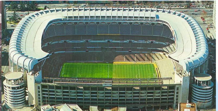
Hier abgebildet das Estadio Santiago Bernabeu in Madrid, in dem das diesjährige Champions League Finale stattfinden soll.