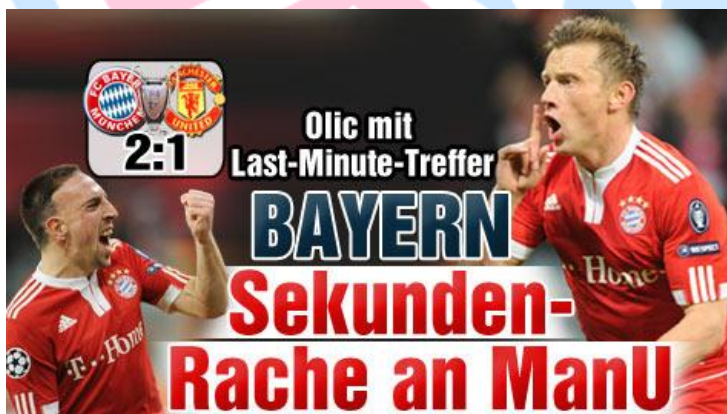
So titelte man bei „Bild- Online“ nach Abpfiff des Spiels gegen „ManU“.