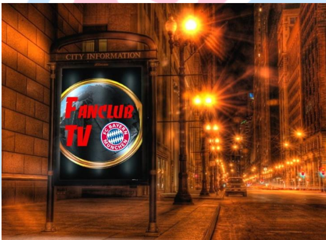
Zukünftig wird mit diesem Symbol auf die kommenden Fanclub-TV Termine hingewiesen.

Auf der letzten Fahrt, zum Heimspiel gegen die roten Teufel, ist im Bus eine lila Wollmütze mit Norweger-Muster liegen geblieben. Außerdem blieb eine schwarze „Handysocke“ mit „Simpsons“ Aufdruck im Bus liegen. Der Besitzer kann sich beim Vorstand der „Anzinger Katzen“ melden, um die verlorenen Sachen abzuholen.