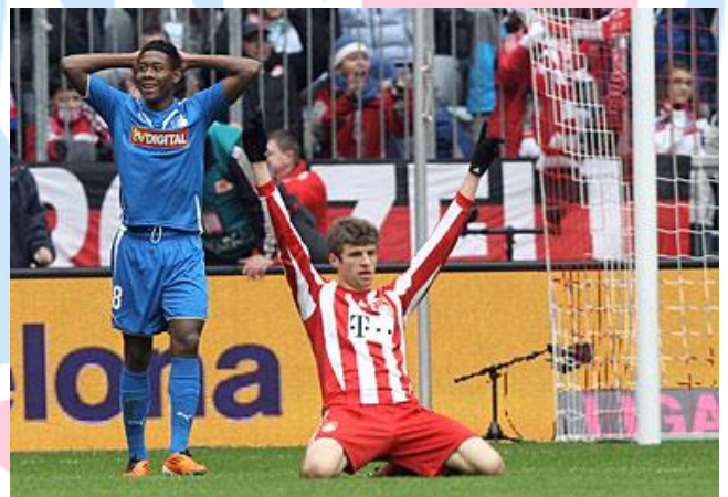
Klare und deutliche Sache gegen 1899 Hoffenheim. Beim 4:0 Sieg „Müllerte“ es wieder.

Diese tolle Resonanz hätte sich der Vorstand natürlich auch für die letzten Mitgliederversammlungen gewünscht.