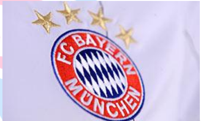
Der FC Bayern München hat sein Fanclub- Programm erneut radikal reduziert.